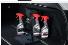
Zestaw kosmetyków samochodowych Toyota Kosmetyki